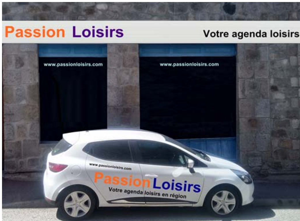
Maquette publicitaire – Agence en travaux non ouverte au public